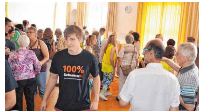
Jedes Jahr interessieren sich zahlreiche Menschen für die ausgestellten Gesellenstücke.