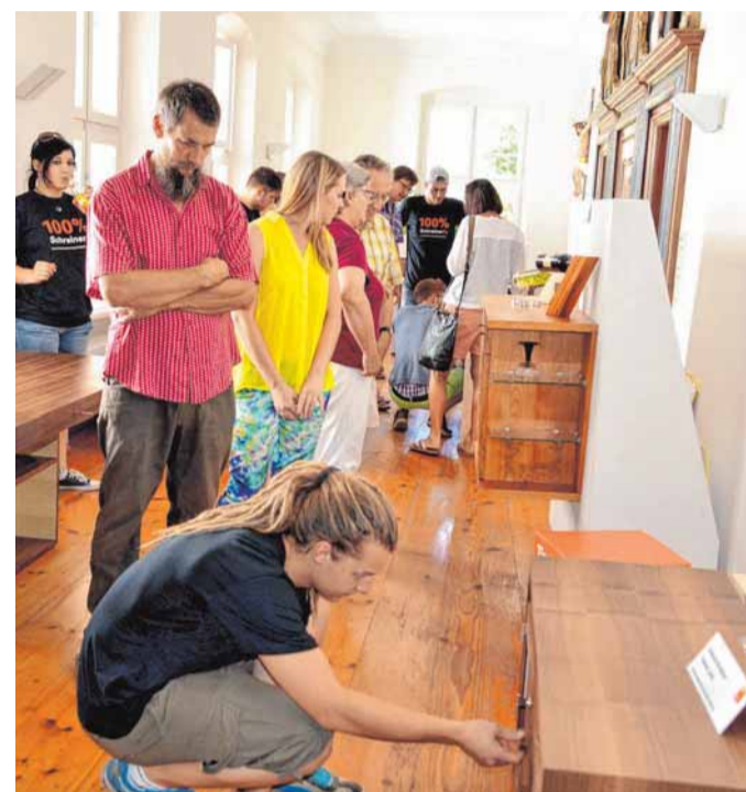
Individuell und kreativ werden die Stücke gestaltet. Handwerklich sind sie ohnehin von höchster Qualität.